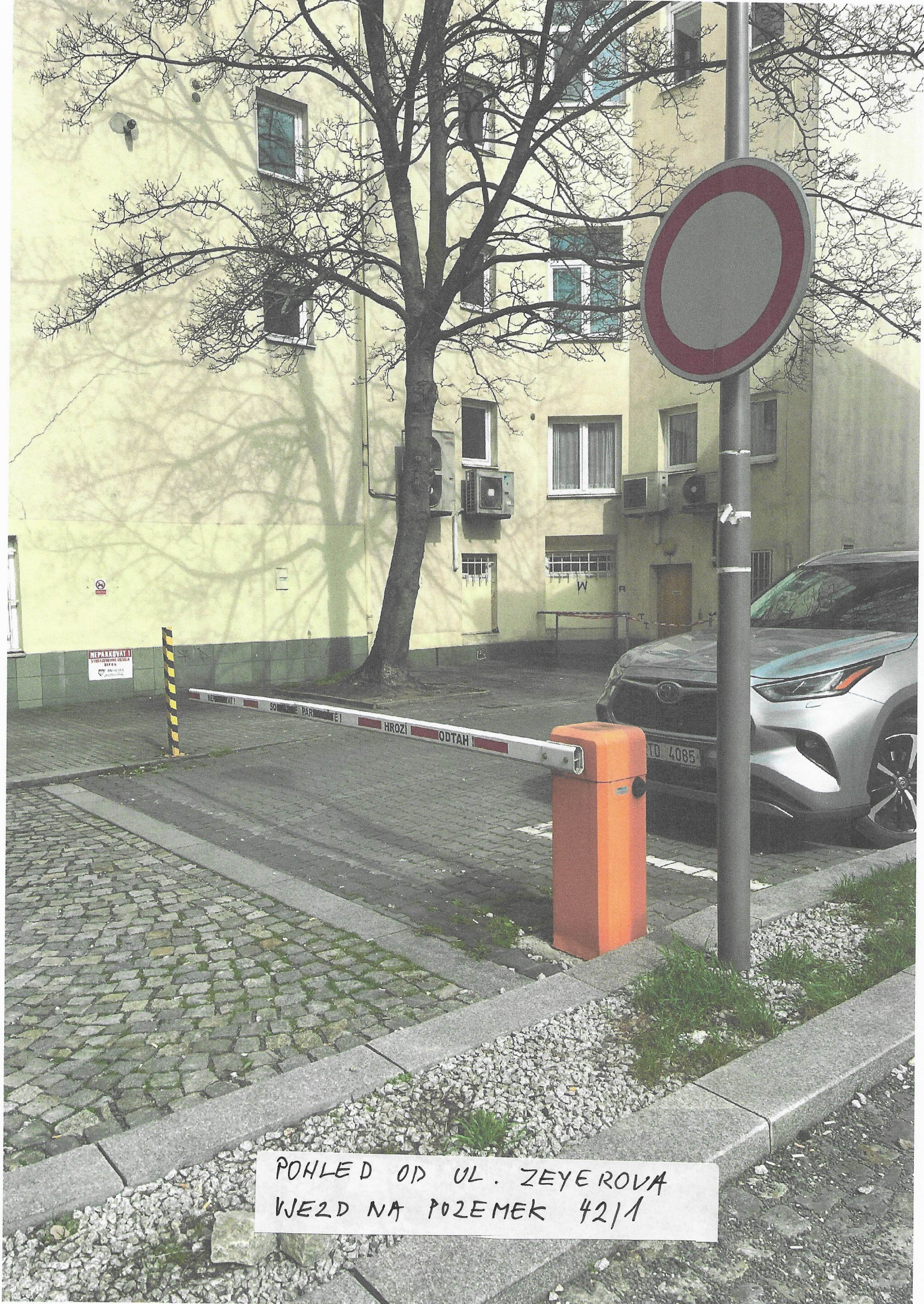
POHLED OD UL. ZEYEROVA WEZD NA POZEMEK 4211