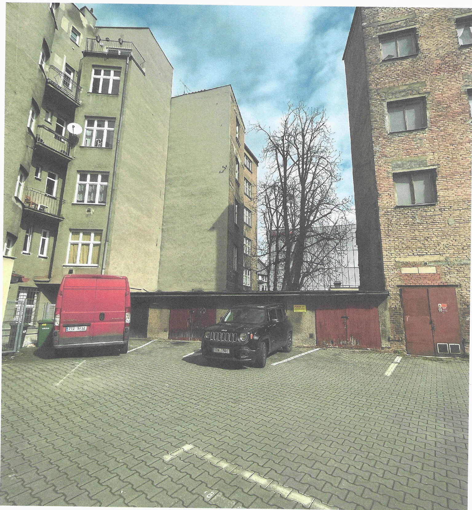
VNITROBLUK - POZEMEK PARC. Č. 42/1