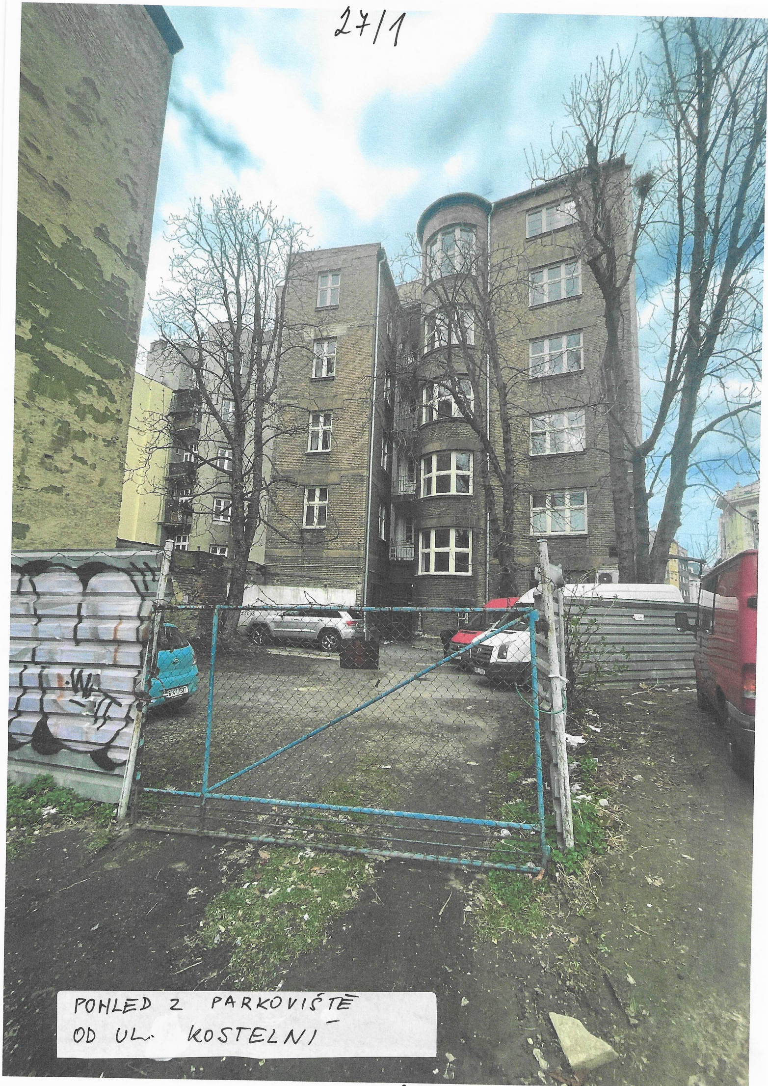
POHLED Z PARKOVIŠTĚ OD UL. KOSTELNÍ