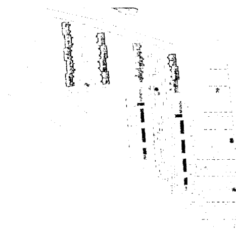
Výřez ze zastavovací studie.

Vyjádření se týká žádosti k návrhu zastavovací studie k projektu Výstavba dostupného bydlení ve Vesničce soužití v k.ú. Muglinov, obec Ostrava, a to pozemku s parc. č. 389/10 ve vlastnictví Statutárního města Ostrava, za účelem vybudování 18 rodinných domků, včetně obslužných komunikací, veřejného osvětlení a úpravy terénu.