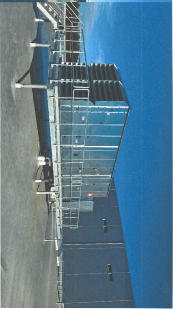
INSTALACE VZDUCHOTECHNIKY – HVAC INSTALLATION