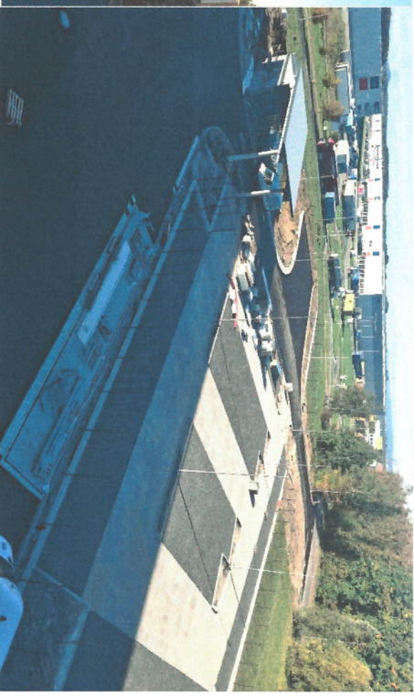
POKLÁDKA ASFALTOVÝCH VRSTEV KOMUNIKACÍ - LAYING OF ASPHALT LAYERS OF ROADS