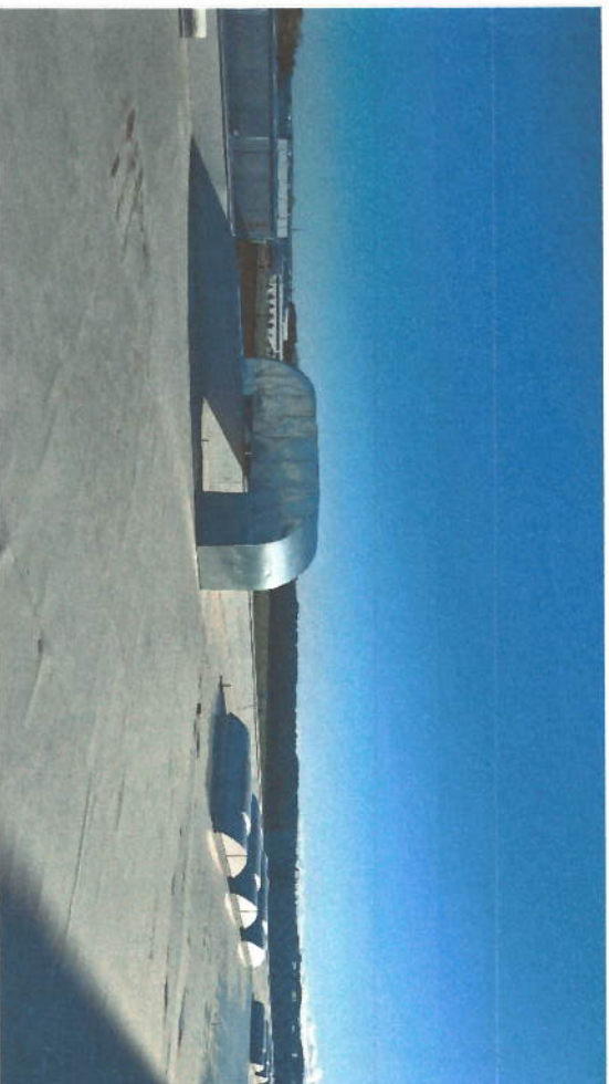
INSTALACE VZDUCHOTECHNIKY – HVAC INSTALLATION