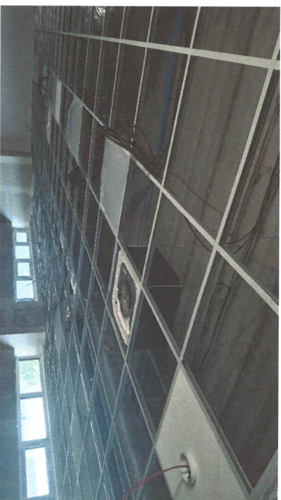
INSTALACE RASTROVÝCH STROPŮ - RASTER CEILING INSTALLATION