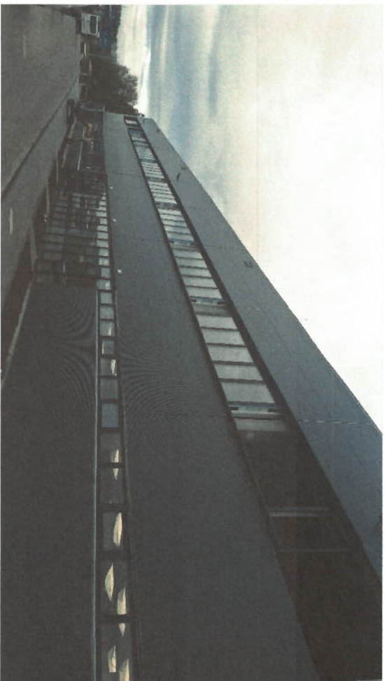
MONTÁŽ OKEN ADMINISTRATIVA - WINDOW INSTALLATION OFFICE BUILDING