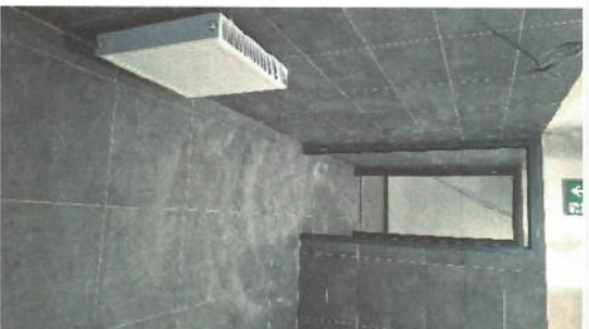
MONTÁŽ INTERIEROVÝCH DVERÍ - INSTALLATION OF INTERIOR DOORS