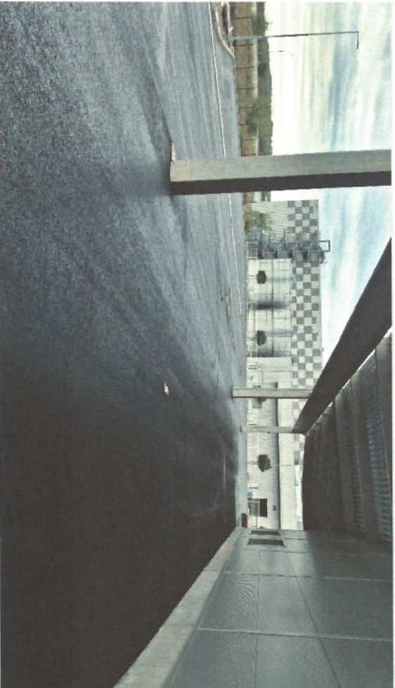
POKLÁDKA ASFALTOVÝCH VRSTEV KOMUNIKACÍ - LAYING OF ASPHALT LAYERS OF ROADS