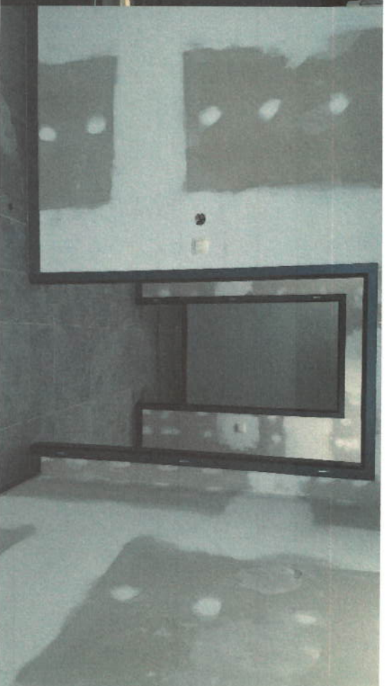
MONTÁŽ INTERIEROVÝCH DVERÍ - INSTALLATION OF INTERIOR DOORS