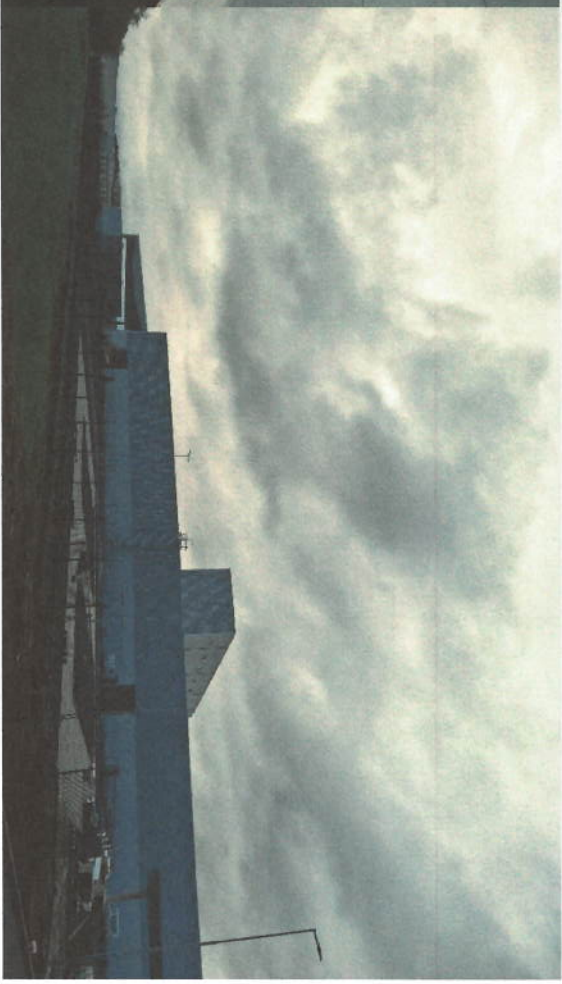
INSTALACE OPLOCENÍ - FENCE INSTALLATION