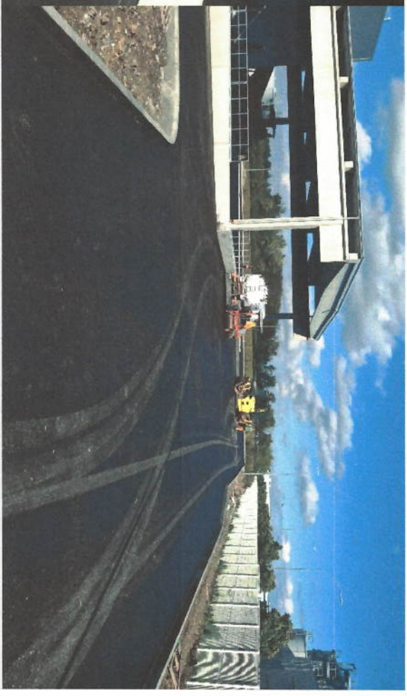
POKLÁDKA ASFALTOVÝCH VRSTEV KOMUNIKACÍ - LAYING OF ASPHALT LAYERS OF ROADS