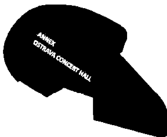
EXISTING BUILDING Ostrava City Cultural Center /House of Culture/