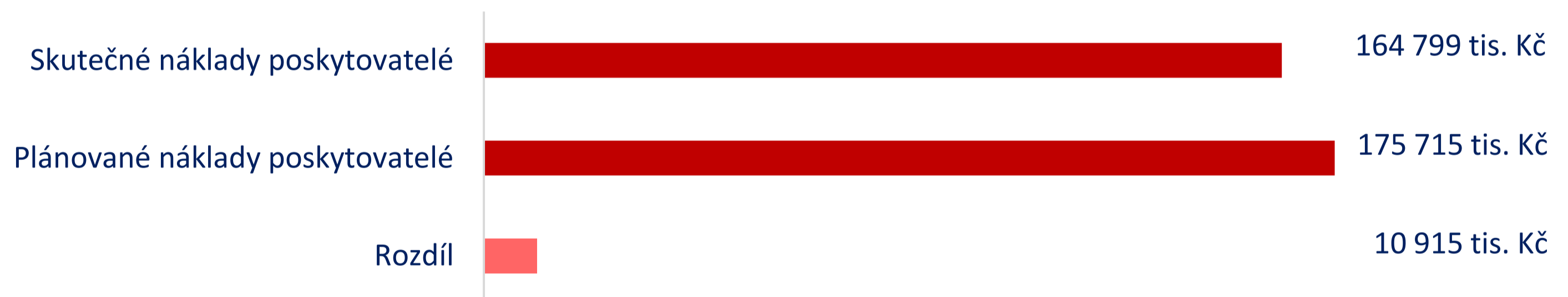
Graf č. 8: Porovnání plánovaných a skutečných nákladů poskytovatelů soc. služeb v roce 2023