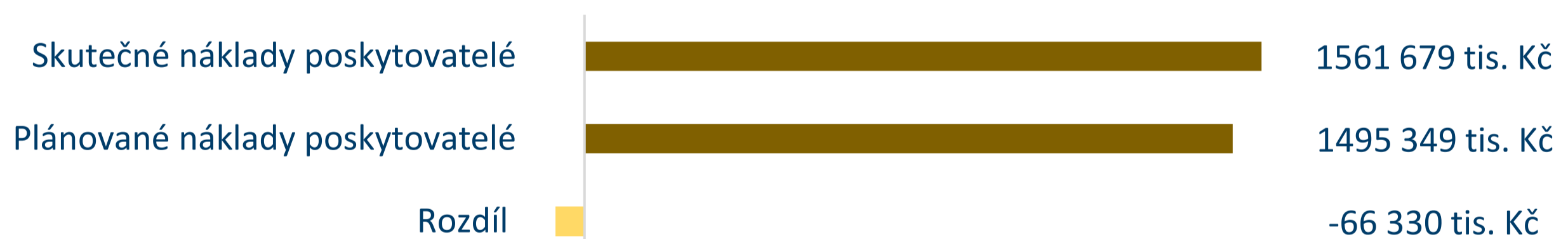
Graf č. 2: Porovnání plánovaných a skutečných nákladů poskytovatelů soc. služeb v roce 2023

*) u dobrovolnictví je uváděn počet dobrovolníků se smlouvou