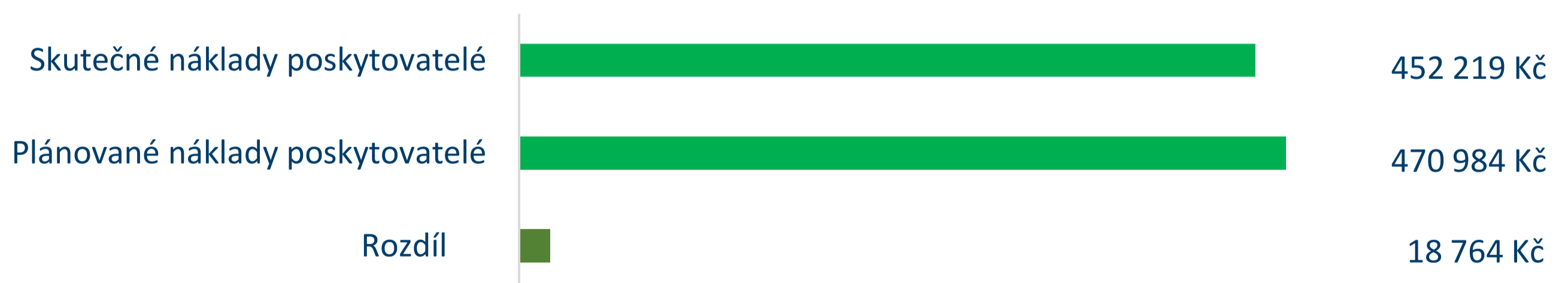
Graf č. 6: Porovnání plánovaných a skutečných nákladů poskytovatelů soc. služeb v roce 2023

**) u dobrovolnictví je uváděn počet dobrovolníků se smlouvou