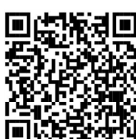
Osamělost seniorů a možnosti jeho řešení