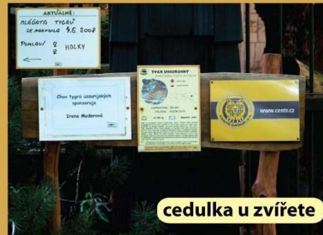
cedulka u zvířete