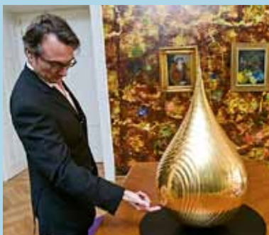
SMUTEK I RADOST. Zlatá slza LacrimAu, unikátní exponát českého pavilonu na loňské světové výstavě v Šanghaji, byla