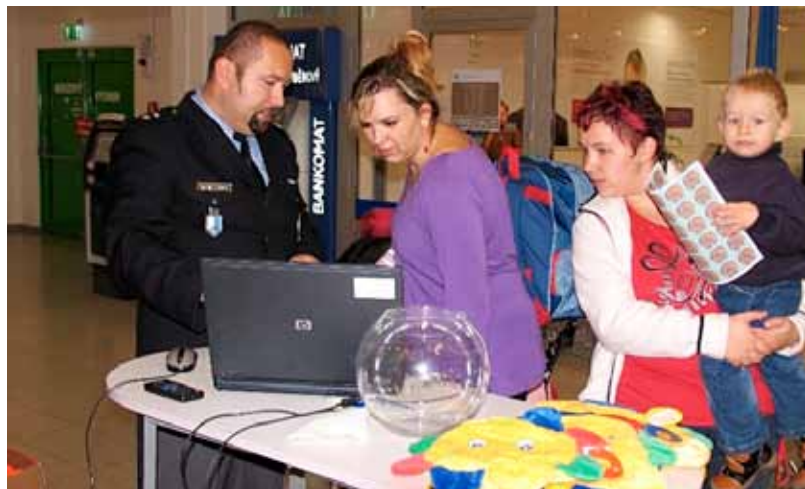
Nakupující v obchodních centrech byli často překvapeni záběry kamer, které zachytily rafinovanost i bezostyšnost zlodějí.

aktivity jsou jednou z účinných metod snížení kriminality. Zvyšují povědomí občanů o možnosti obrany před zloději, kapsáři a dalšími pachateli. Nejúčinnější, nejlacinější a nejjednodušší ochrana je nedávat pachatelům příležitost, aby nás mohli okrást. Akce navazuje na úspěšné projekty Městského ředitelství Policie ČR Společně proti kriminalitě a Vem si mě. (ps)