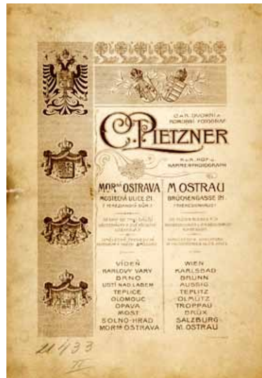
Zadní strana fotografie s reklamou ateliéru