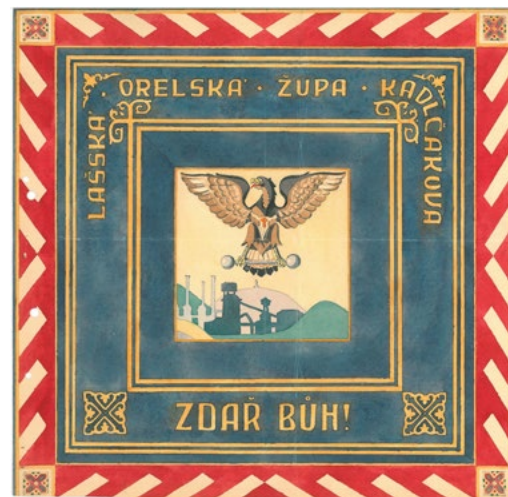
Návrh orelského praporu, který byl patrně k vidění i během svinovského župního sletu

členové pořadatelské župy, ale i žup okolních. Župní slet ve Svinově nebyl výjimkou, jelikož na zdejší slavnost dorazili i spříznění orlí z opavské župy nebo orelské zástupci ze Slovenska. Cílem průvodu bylo sletišťe, jež tvořila zahrada pana Hurníka, nacházející se naproti kostelu. Rozměry zahrady ovšem nedostačovaly, i proto někteří orlové museli odejít. Po zahajovacích proslovech následovala státní hymna, vztyčení státní vlajky a úvodní část zakončilo pěvecké vystoupení mužského sboru.