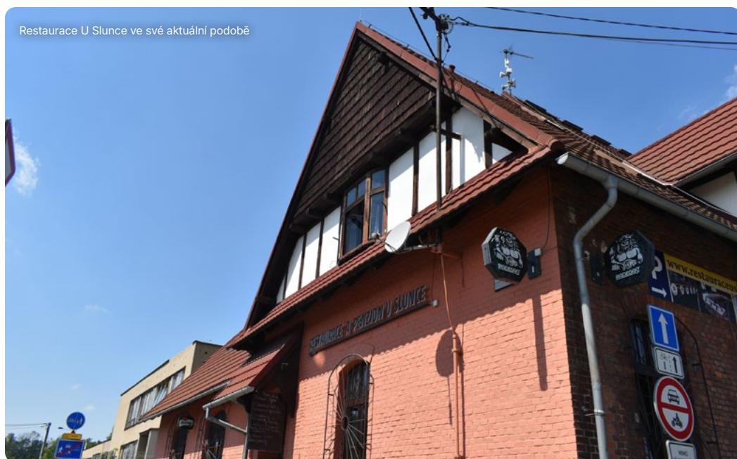
Restaurace U Slunce ve své aktuální podobě

Mezi tělocvičné spolky, které měly nemalé zastoupení na území meziválečného Ostravska lze zařadit i katolického Orla. Krátce po vzniku Československa sdružovala zdejší orelské představitele Lašská župa Kadlčákova, pojmenovaná po orelském představiteli Josefu Kadlčákovi. Župa, sídlící v Moravské Ostravě, se členila na okrsky a dále na jednoty. Za největší župní události byly považovány slety, které se konaly v různých orelských centrech po celé župě. Roku 1934 se mezi pořadatelská místa zařadil i Svinov.