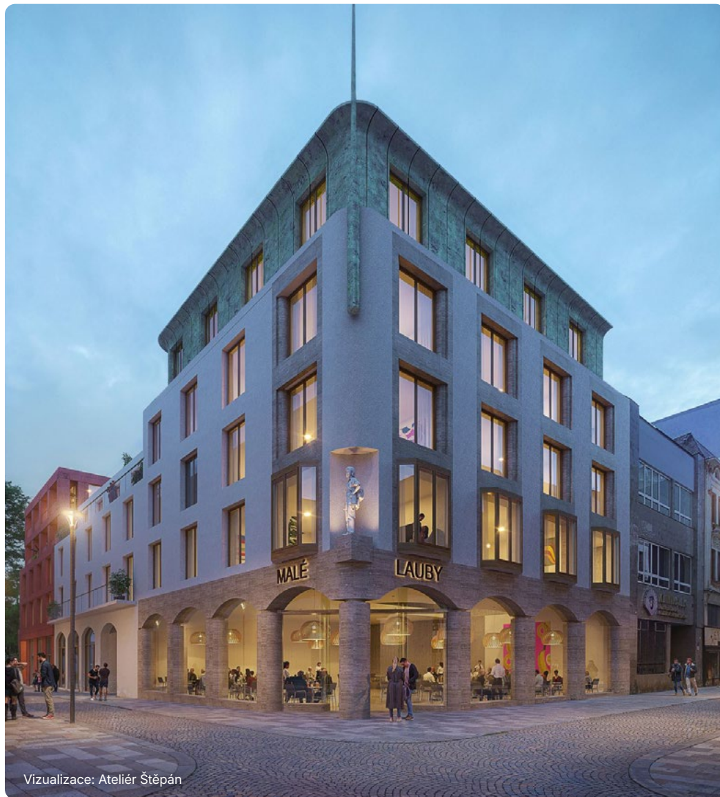
Vizualizace: Ateliér Štěpán

„Významným prvkem návrhu je aktivní parter, který přispěje k oživení centra města a přirozenému využití veřejných prostranství. Současně architektonické řešení vytváří podmínky pro umístění doplňkové funkční občanské vybavenosti a služeb, přispívající k atraktivitě a funkční