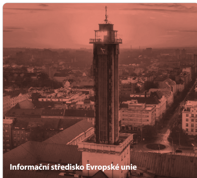
Informační středisko Evropské unie

Ani v dalších měsících nebude o aktivity nouze. Připravují se programy a cykly zaměřené na kyberbezpečnost pro seniory i žáky, mediální gramotnost pro učitele nebo projekt EUtejný, který přiblíží evropská témata veřejnosti netradiční formou. Více na www.europedirect.cz pobočka Ostrava. RED