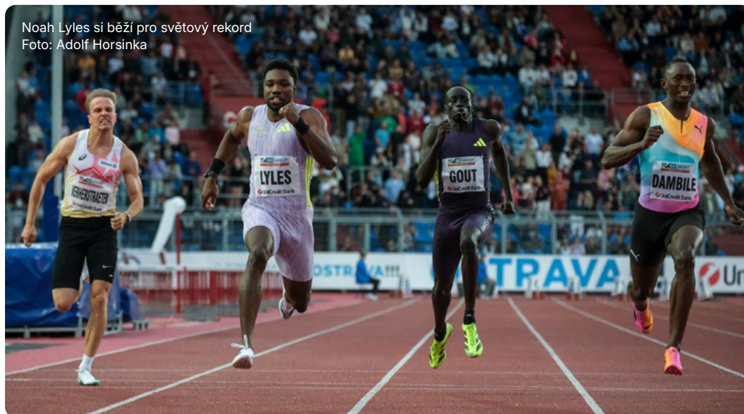
Noah Lyles si běží pro světový rekord

Dařilo se i českým reprezentantům. V běhu na 400 metrů zvítězila Lurdes Gloria Manuel, a to ve svém novém osobním rekordu. Časem 49,74 sekundy posunula svůj doposud nejlepší