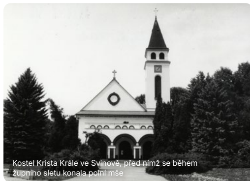
Kostel Krista Krále ve Svinově, před nímž se během župního sletu konala polní mše

Odpolední program zahájilo odbíjení zvonů zdejšího kostela společně se svatým požehnáním. Poté vyrazil na cestu průvod, který se vydal směrem k Třebovicím. Defilé se účastnily všechny složky orelské organizace, tj. žactvo, dorost a dospělé členstvo obojího pohlaví. V čele průvodu vyrazili na koních zástupci orelské župy. Nesměli chybět ani orlové oblečení ve slavnostních krojích. Průvodu se zúčastnilo přes 4 500 lidí s 15 spolkovými prapory, 16 žákovskými vlajkami a 9 vlajkami dorostenců. Takto významných událostí se nezúčastňovali pouze