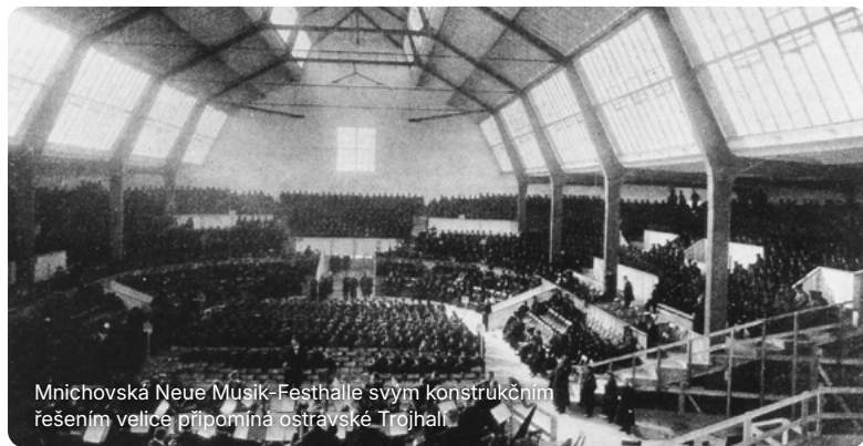
Mníchovská Neue Musik-Festhalle svým konstrukčním řešením velice připomíná ostravské Trojhalí.

Již 17. a 18. 5. 2025 zažije Ostrava uvedení Symfonie č. 8 Es dur Gustava Mahlera, která bývá pro svou monumentálnost označována jako „Symfonie tisíců“. Výjimečný projekt Mahler 8, za nímž stojí Trojhalí Karolina a Moravskoslezská Sinfonietta, propojí 600 umělců z Česka i zahraničí a promění industriální prostor Trojhalí v jedinečný koncertní sál.