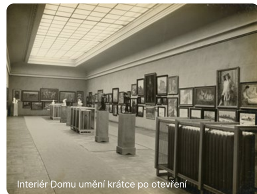
Interiér Domu umění krátce po otevření

V roce 1932 v Ostravě vystavující malíř Jan Zrzavý (1890–1977) byl naprosto uchvácen haldami nacházejícími se na periferii města. Dokladem toho je několik obrazů s touto tematikou a Zrzavého slova publikovaná na počátku 40. let v periodiku Život: „V době, kdy jsem maloval svoje nejlepší obrazy z Ile de Sein , přišel jsem do Moravské Ostravy. Nebyl jsem necitelný k atmosféře a poezii tohoto průmyslového a zakouřeného města, ale malířské zjevení dostalo se mi až za městem...vše žilo svým vlastním fantastickým životem tvarů a barev, svět zvláštní divoké mimozákonné krásy...“