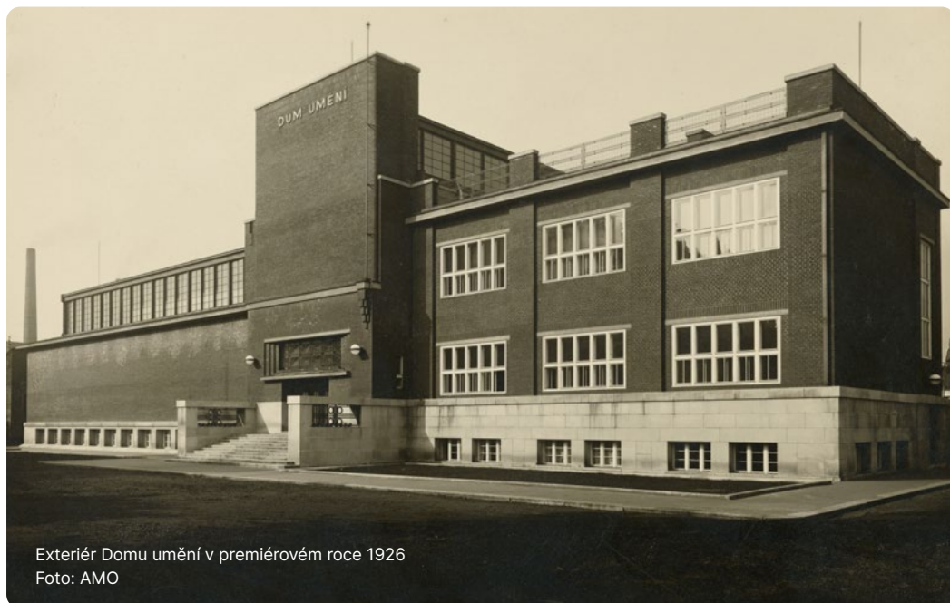
Exteriér Domu umění v premiérovém roce 1926

Na počátku 20. století v Ostravě neexistoval výstavní pavilon, v němž by byly pravidelně pořádány výstavy, a v ostravské populaci nebyla početnou měrou zastoupena klientela, která by jevila dostatečný zájem o umělecká díla. Tato proto byla prezentována pouze sporadicky, a ještě v nevyhovujících prostorách.