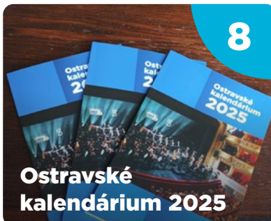
Ostravské kalendárium 2025