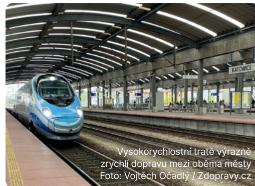
Vysokorychlostní tratě výrazně zrychlí dopravu mezi oběma městy

Pro fungování megalopole bude mít zásadní význam zamýšlená vysokorychlostní železnice, jež by se měla stát skutečností v horizontu 10–15 let. Přibližně stokilometrovou vzdálenost mezi Ostravou a Katovicemi by pak vlakové soupravy urazily za méně než půl hodiny. Něco takového by způsobilo bezmála revoluci v místní pracovní mobilitě. O tom, že spolupráce Ostravy a Katovic přináší výsledky mezinárodní úrovně už máme důkaz.