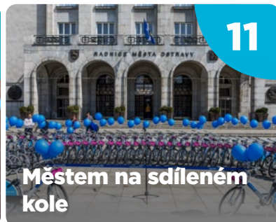
Městem na sdíleném kole