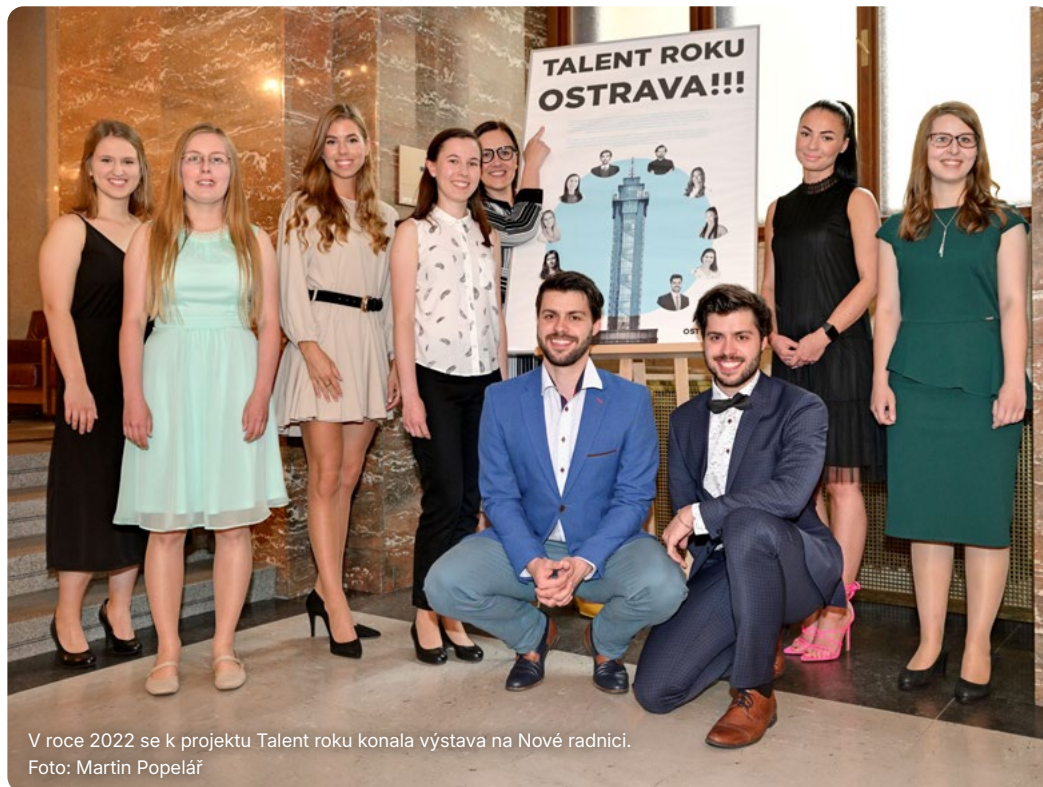
V roce 2022 se k projektu Talent roku konala výstava na Nové radnici.