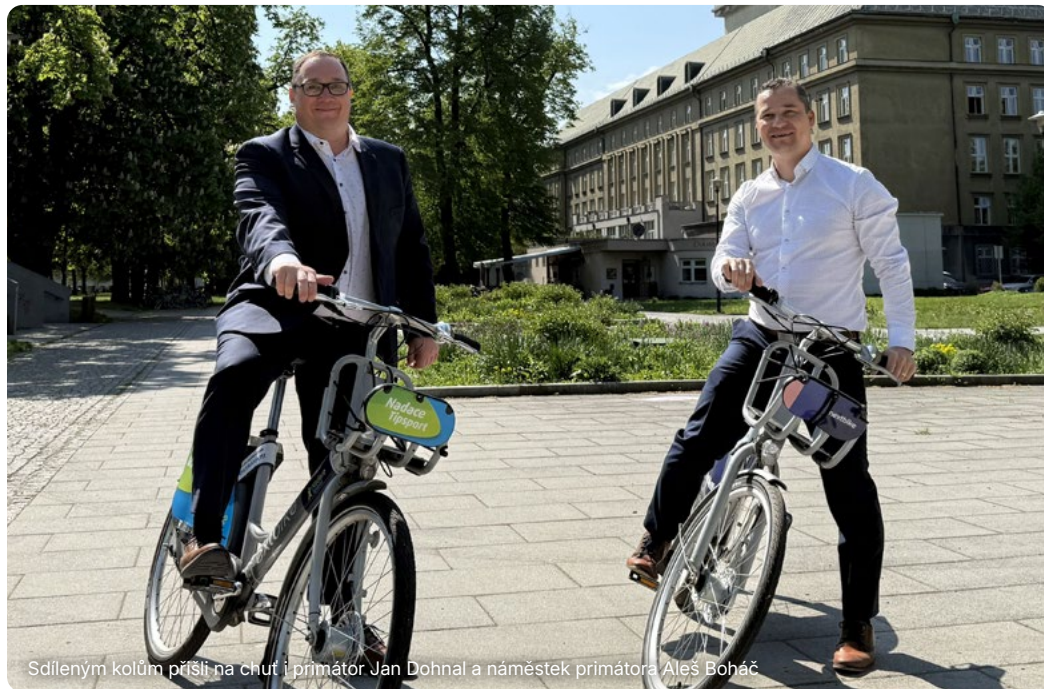
Sdíleným kolům přišli na chuť i primátor Jan Dohnal a náměstek primátora Aleš Boháč

„Data za rok 2025 ukazují, že sdílená kola jsou pro obyvatele Ostravy přirozenou součástí dopravy po městě. Z dlouhodobého pohledu vidíme stabilní růst zájmu i to, že lidé si kola půjčují především pro každodenní krátké cesty – tedy přesně tam, kde mají ve městě největší přínos. V průběhu roku 2024 jsme prostřednictvím odboru strategického rozvoje realizovali počítačové mapy, do kterých se zapojili obyvatelé města. Na základě jejich podnětů jsme následně v loňském roce rozšířili ve spolupráci s firmou nextbike síť stanic tak, aby lépe odpovídala skutečným potřebám v jednotlivých lokalitách,“ sumarizovala náměstkyně primátora Lucie Baránková Vilamová.