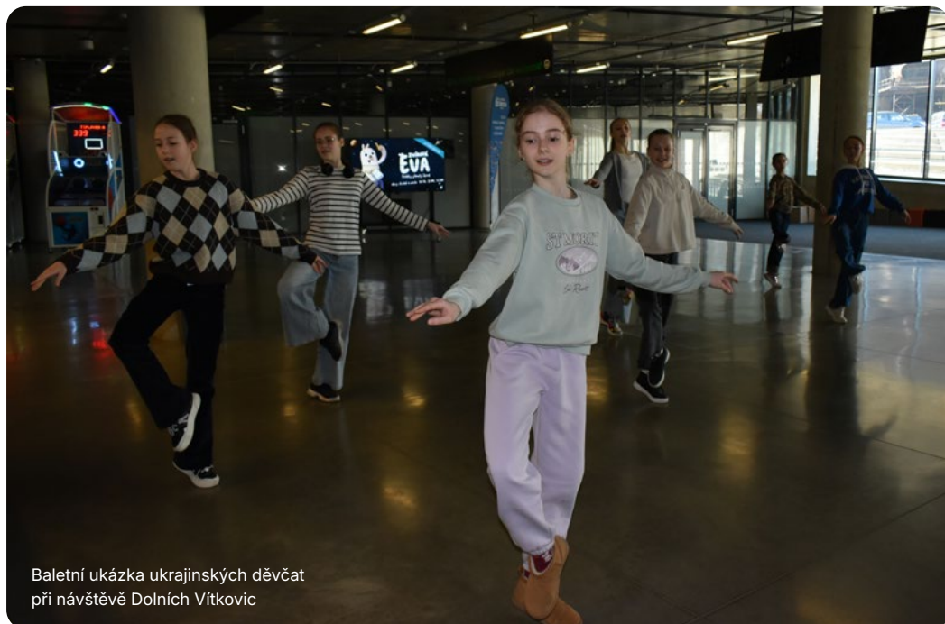
Baletní ukáзка ukrajinských děvčat při návštěvě Dolních Vítkovic

Ukrajinské Dnipro je od roku 2024 partnerským městem Ostravy. Na základě tohoto partnerství a vedena solidaritou s těžce zkoušenou zemí zorganizovala moravskoslezská metropole pro 40 dniperských dětí dvanáctidenní tábor v Beskydech s bohatým a zajímavým programem.