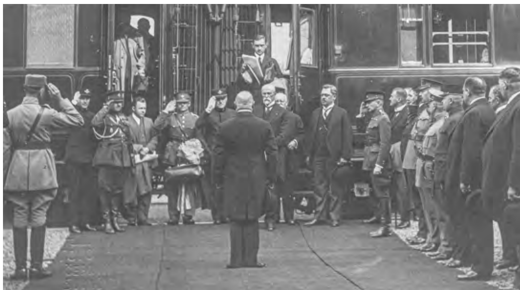
Přivítání hlavy státu v Přívoze

Již sto let uplynulo od velké kulturně politické události, památné návštěvy prezidenta republiky Tomáše G. Masaryka na Hlučínsko a Ostravsko. Prezident se nejprve 24. června 1924 při cestě z Opavy zastavil v hlučínských obcích Kateřinky, Kravaře, Hlučín, kde se zastavil nejdéle, a pak v Ludgeřovicích.