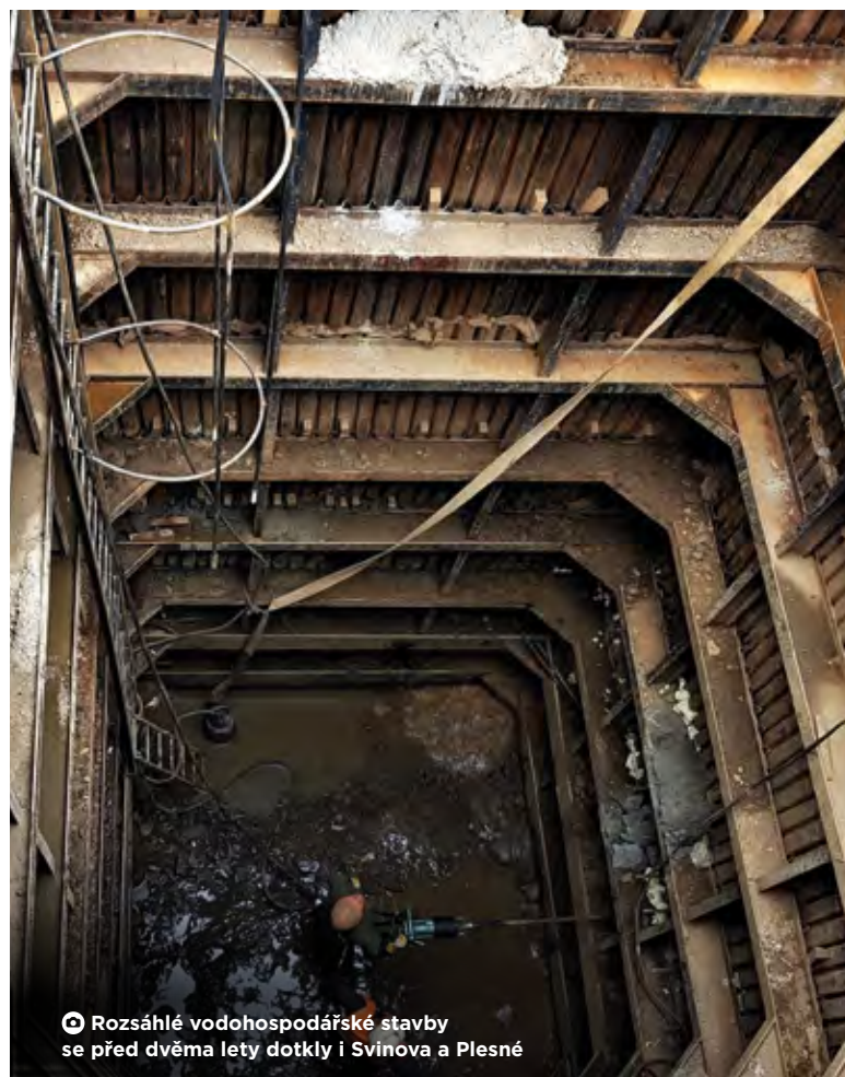
Rozsáhlé vodohospodářské stavby se před dvěma lety dotkly i Svinova a Plesné

Omezení se přirozeně dotknou také hromadné dopravy. Aktualizované informace v tomto směru najdete na www.dpo.cz . MS