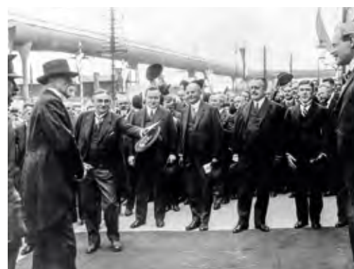
Prezidentská návštěva ve Vítkovických železárnách