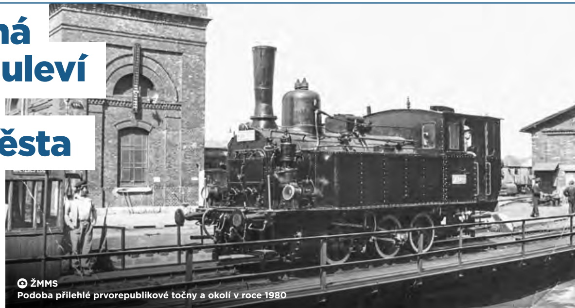
ŽMMS Podoba přilehlé prvorepublikové točny a okolí v roce 1930

Cílem navrhované stavby je odlehčit dopravě směřující od severu do oblasti centra Ostravy tak, že bude nabídnuta trasa vedená okrajem obytné zástavby, a nikoliv jejím středem. To pomůže ulicím Nádražní a Poděbradova od automobilové dopravy a vytvoří podmínky pro lepší dopravní obsluhu zastavených a zastavitelných ploch. Současně tak dojde i k odlehčení historického jádra města, které