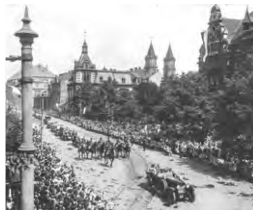
TGM přijíždí do Moravské Ostravy

Po dalších proslovech odjel prezident Masaryk se svým průvodem do Přívozu k Dolu František, zde si prohlédl závod a různá technická zařízení a vyptával se na detaily provozu. Rozmlouval také se skupinou dělníků, ptal se, jak se jim daří a na různé podrobnosti. Dělníci byli zřejmě potěšeni jeho přívětivostí, neboť s ním hovořili jako se svým přítelem. Ve Vítkovicích si pan prezident prohlédl novou ocelárnu a válcovnu Vítkovických železáren, kde byl přivítán nadšenými ovacemi a spontánním provoláváním slávy. Na náměstí v Mariánských Horách byl očekáván několikatisícovými zástu-