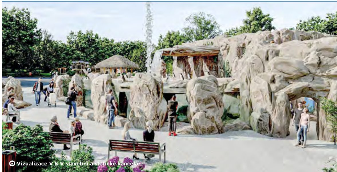
© Vizualizace V &amp; V stavební a statické kanceláře