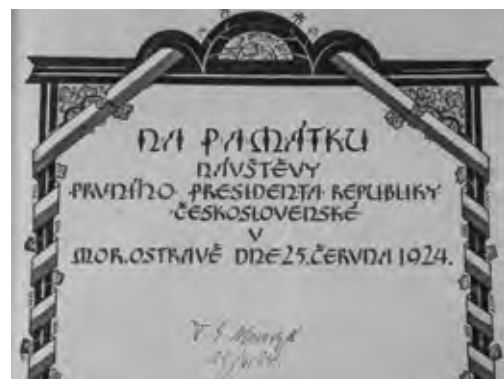
Zápis Prezidenta Osvoboditele v pamětní knize města