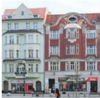
DC ADRA sídlí v červeném domě na Jiráskově náměstí.

Ostravské Dobrovolnické centrum ADRA vzniklo v roce 2008. Sídlí na Jiráskově náměstí 4 a věnuje se péči o děti, seniory, umírající a osoby se zdravotními postiženími.