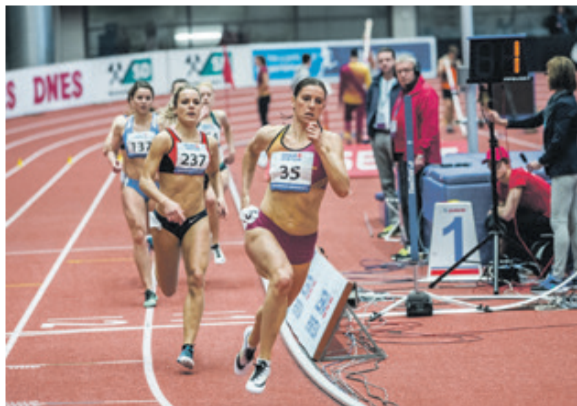
Zuzana Hejnová se stala mistryní republiky, když prolétla dvousetmetrovým oválem v čase 52,34 s. Ostravský šampionát byl jejím halovým vrcholem. Světová šampionka začíná přípravu na letní olympiádu v Riu.