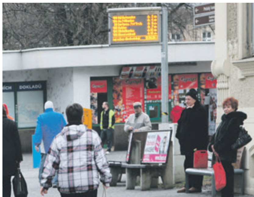
Inteligentní zastávky se osvědčují

životního prostředí. Statutární město Ostrava dlouhodobě aktivně přistupuje k řešení negativních dopadů znečištěného ovzduší, což dokazují např. v letech 2014–15 realizované projekty Izolační zeleň města Ostrava, v rámci kterých bylo vysazeno více než 26 tisíc kusů nových dřevin na ploše 98,8 hektaru. Jedním z hlavních cílů této masivní výsadby bylo zajištění zachytu prašnosti a zlepšení životního prostředí ve městě. Pro doplnění uvádím, že město Ostrava má od roku 2000 zpracován pasport veřejné zeleně, který bývá každoročně aktualizován na základě podkladů z městských obvodů. Z pasportu lze vyčíst např. aktuální výměru veřejných trávníkových ploch na pozemcích ve vlastnictví města, která je 999,1 hektaru, počet soliterních stromů, keřových skupin a jiné údaje.“ (vi)