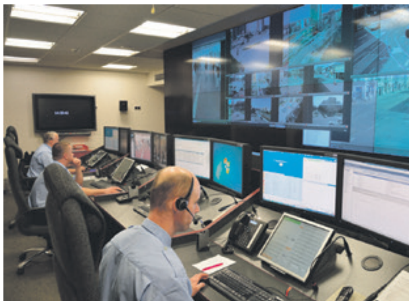
Vyhodnocovací stanoviště Městské policie Ostrava

Informace o rozmístění jednotlivých kamer lze najít na webových stránkách městské policie www.mpostrava.cz v sekci Technické prostředky. (ju)