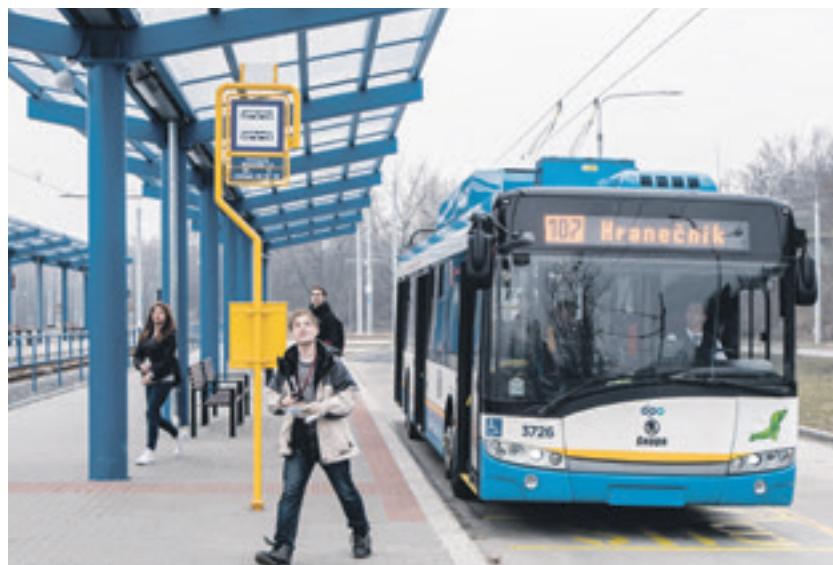
Staronová trolejbusová linka 107 na konečné přestupního terminálu Hranečnick

Občané Radvanic a především Bartovic mohou více využívat příměstské spoje, protože autobusové linky z Havířova jsou nově zapojeny do ODIS. Z dolní části Bartovic se mohou ve špičkách dostat rychle na Hranečnick linkami 383 a 440 a k zastávce Nová huť jižní brána novou linkou ODIS č. 444. Na ulici Těšínské pak mohou využívat směrem k Hranečnicku novou linku ODIS č. 441, která jezdí téměř po celý den každých 20 minut. Špičkové linky 532 a 552, jedoucí po ulicích Fryštátské a Rudné, jsou v Ostravě nově vedeny přes Mírové náměstí. Občané Kunčiček v okolí zastávky Vratimovská mohou nově využívat i nových rychlých špičkových linek ODIS číslo 443 jedoucích po Místecké na ÚAN a číslo 445 jedoucích po Rudné do Poruby k Fakultní nemocnici. Ve všech spojích uvedených linek i linek 531 a 551 jsou cestující nově odbavováni v tarifu Ostrava XXL včetně vzájemného přestupu z příměstských linek na linky DPO, avšak