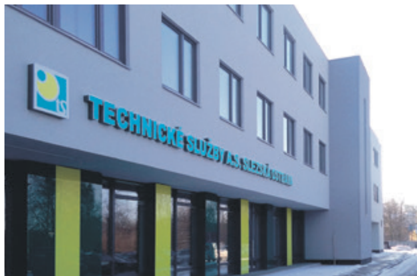
Správa společnosti Technické služby Slezská Ostrava v ulici Čs. armády