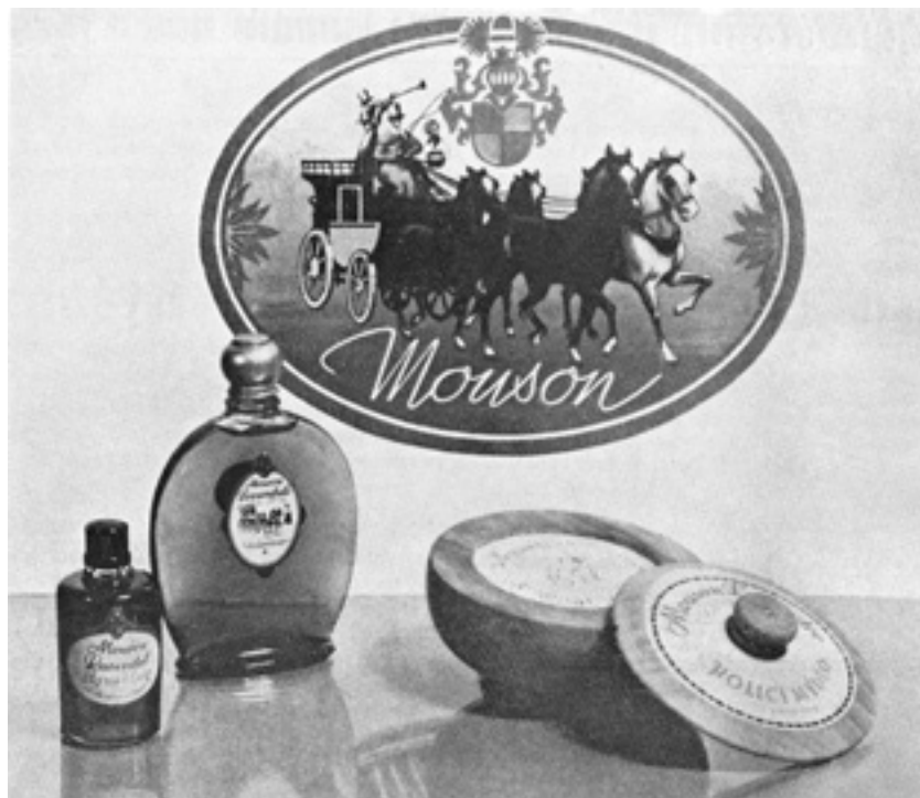
Německá kosmetická firma Mouson používala pro své výrobky etiketu se starým anglickým dostavníkem. V roce 1922 s ní uzavřela kontrakt ostravská Silbermannova a Brüllova továrna.