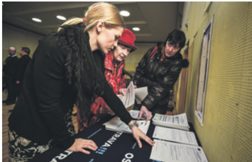
Semináře pro zájemce o kotlíkové dotace zaměřily do městských obvodů. Snímek je z Poruby.

Informace jsou k dispozici na webových stránkách www.dychamproostravu.cz či telefonické lince 595 622 355. Zájemci mohou podávat žádosti na krajském úřadě do 29. dubna 2016. (ph)