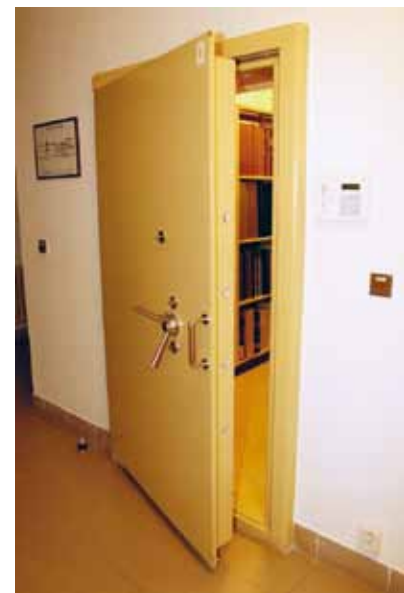
Dnes slouží k uchování vzácných dokumentů technicky kvalitní trezor.