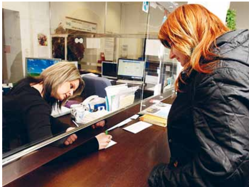
U přepážek Střediska informačních služeb v Radnici města Ostravy se denně vystřídají i stovky lidí.

občanský průkaz, cestovní doklad, zbrojní průkaz, řidičský průkaz, vojenská knížka, služební prů-