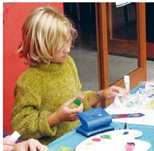
Násilím v rodině trpí nejvíce děti.