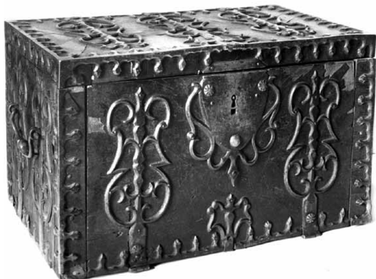
Tuto truhlu naši předkové vymysleli dobře, listinu uchovala.