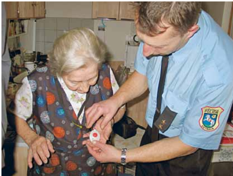
Obsluha přenosného tlačítka je velmi jednoduchá